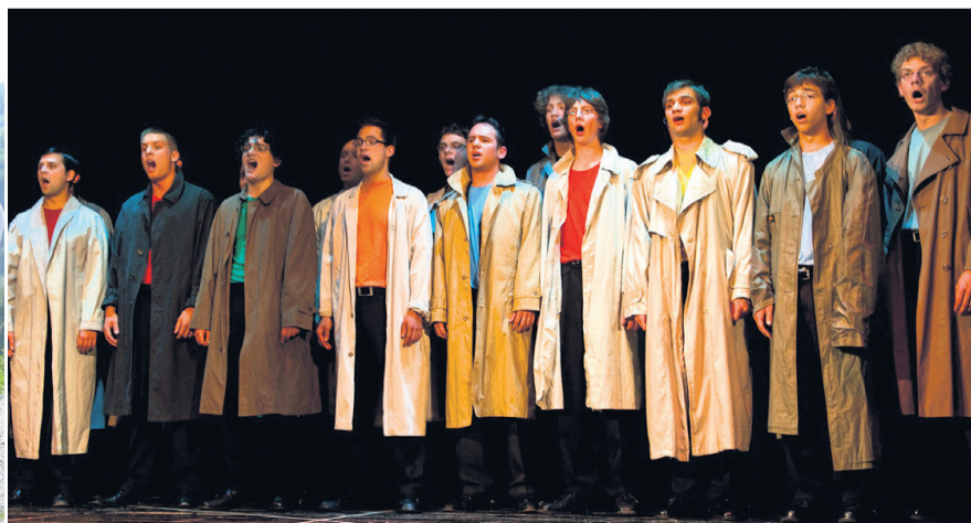
Im Sommer 2003 wurde der Männerchor der Ehemaligen «Rychenbergler» gegründet (Bild links), heuer kann er sein 10-jähriges Bestehen feiern.

Winterthur: Es war an einem kalten Januarabend 2003, als sich einige junge Herren zusammensetzten, um über ein Projekt mit dem Namen «The Rychenbirds» zu diskutieren. Entstanden ist ein Männerchor, der aus einer Gruppe von Sängern besteht, welche alle in irgendeiner Weise mit der Kantonsschule Rychenberg in Winterthur verbunden sind, sei es nun als Lehrer oder ehemalige, gleichsam dem Bildungsnest entflogene Schüler. Diese Verbundenheit ist einerseits Keimzelle